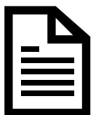
FICHE VITRAGE PDF