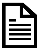
PROCÈS-VERBAL N° RS 15-133