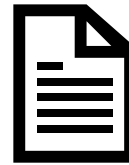
PLAN TECHNIQUE DWG