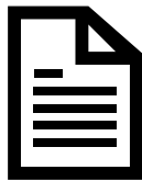
PLAN TECHNIQUE PDF